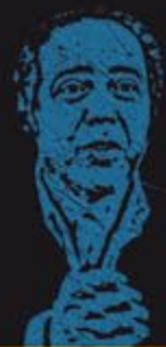
ARNAUD / DESPLECHIN