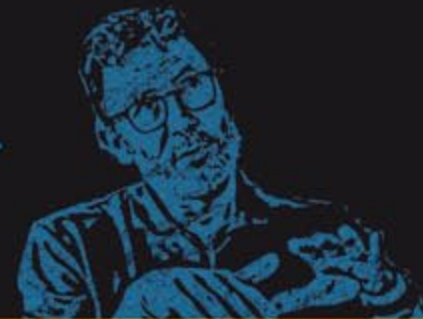
MICHEL / HAZANAVICIUS