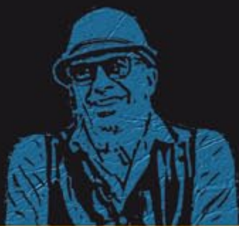
JACQUES / AUDIARD