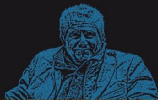
CLAUDE / LELOUCH