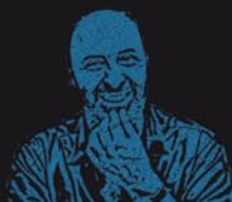
CEDRIC / KLAPISCH