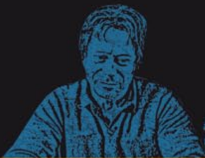
MATHIEU / AMALRIC