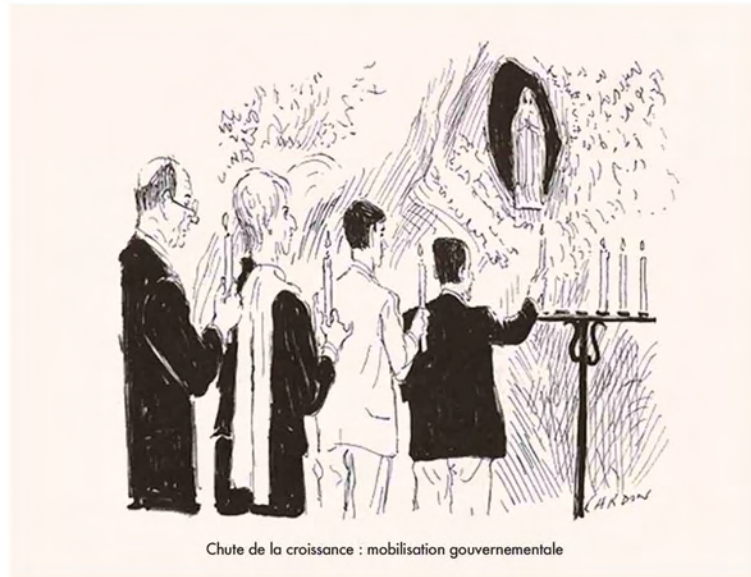
Chute de la croissance : mobilisation gouvernementale