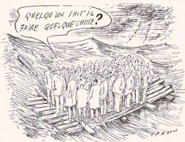
Crise : Banquiers et traders survivront-ils ?

PROGRAMMATION / DISTRIBUTION : Coopérative DHR (Direction Humaine des Ressources) T : +33 9 53 77 56 74 / +33 6 84 76 44 68 E-M : cooperative@d-hr.org